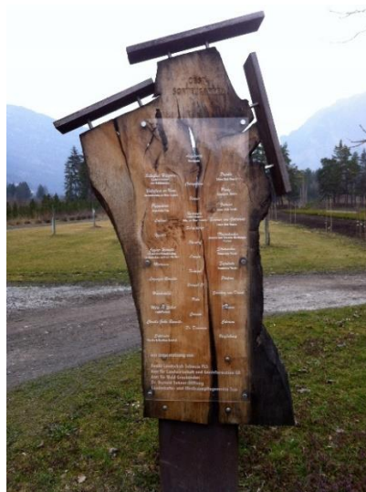
Infotafel mit Sortenname und Patenschaft

Unterstützen Sie unsere Bemühungen in dem Sie dem Obstverein Mittelbünden beitreten, uns finanziell oder gar durch eine Patenschaft unterstützen. Dieses lebendige Kulturgut ist nur mit grossem Aufwand zu erhalten.