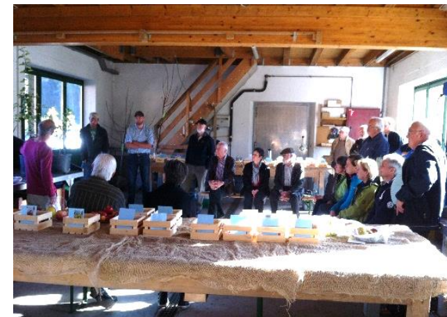
Vortrag und Ausstellung für Mitglieder

Weitere Informationen entnehmen Sie bitte unserer Homepage www.obstverein-gr.ch