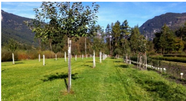
Apfelsorten-Sammlung in Rodels

Auf dem Areal des Kantonalen Forstgartens Rodels betreibt der Verein eine Apfelsorten-Sammlung. Auf 35 Hochstammbäumen mit je einer Apfelsorte, findet sich hier eine ansehnliche Auswahl an hiesigem Erbgut, das ausschliesslich aus Graubünden stammt.